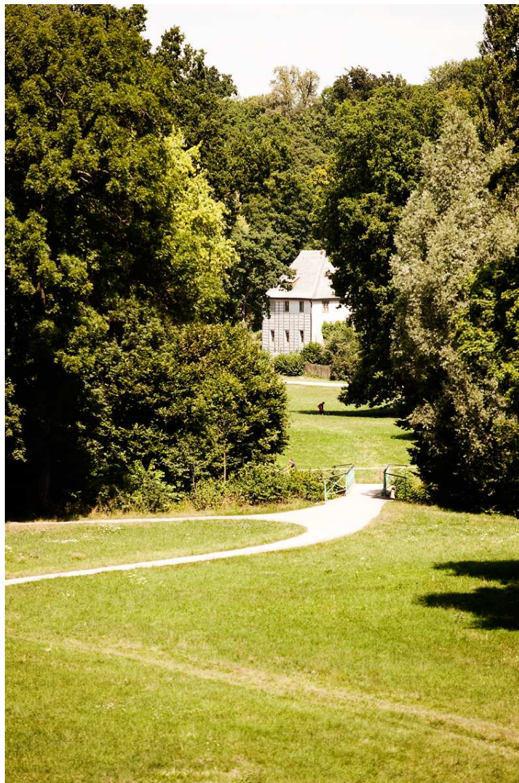
Abb. 6: Johann Wolfgang von Goethe – Gartenfreund und Gartengestalter Sein Gartenhaus im Park an der Ilm

sichtbare Geist, der Geist die sichtbare Natur sein“ ( Schelling , Ideen zu einer Philosophie der Natur, 1797, LXIV). Diese Ideen haben auch das Naturverständnis in unserem Elternhaus geprägt. Goethe , das wurde uns vermittelt, hatte erkannt, dass man nichts wirklich erkennen kann, wenn man ihm nicht irgendwie zugehört, wenn man Natur nicht in ganzheitlicher Anschauung erfasst, denn es ist „ jede Creatur nur ein Ton eine Schattirung einer großen Harmonie, die man auch im ganzen und großen studiren muss sonst ist jedes Einzelne ein tochter Buchstabe “ ( Goethe WA IV 6, 389f). Goethes Entdeckung des Zwischenkieferknochens 1784 (mit J. C. Loder , zuvor aber schon 1780 von Felix Vicq d'Azyr entdeckt), ließ ihn den Menschen als Teil einer Evolution sehen, stellte ihn damit voll in die Natur: „ Du führst die Reihe der Lebendigen / Vor mir vorbei und lehrst mich meine Brüder / Im stillen Busch, in Luft und Wasser kennen “ ( Faust , 3225). Der Mensch steht in der „ Reihe der Lebendigen “ und er „ kennt sich nur selbst, in sofern er die Welt kennt, die er nur in sich und sich in ihr gewahr wird. Jeder neue Gegenstand, wohl beschaut, schließt ein neues Organ in uns auf “ ( Goethe 1923 LA I 9, 307f; vgl. Eckermann 29. 1. 1826). Natur , unsere eigene zumal, „ hat weder Kern noch Schale, Alles ist sie mit einemale “ ( Goethe 1820, Unwilliger Ausruf LA I 9, 223).