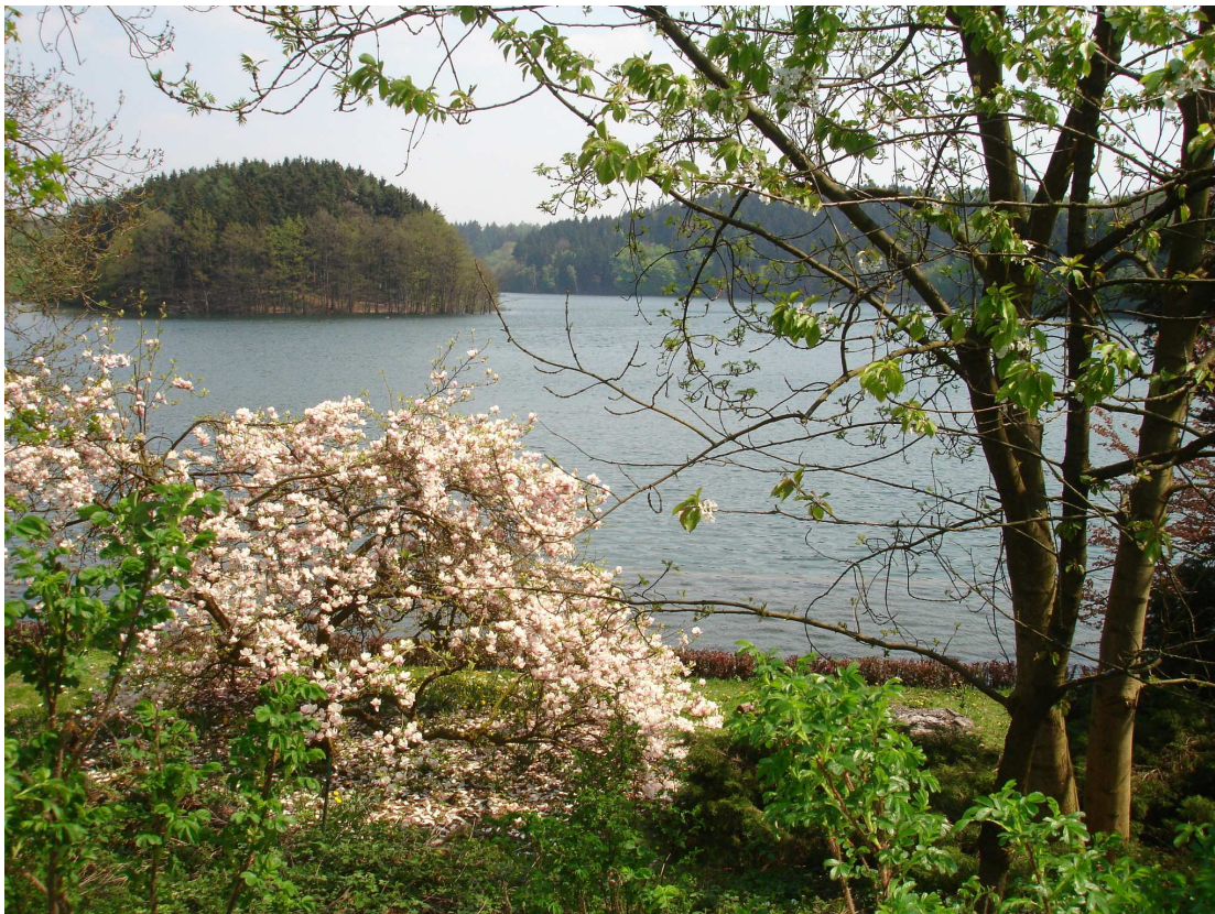
Abb. 7. Magnolie im Uferpark der Europäischen Akademie für biopsychosoziale Gesundheit am Beversee

Sträucher, Blumen erfüllen. Ich habe Formen einer „ green meditation “ entwickelt, die auch bei kurzen Zeiten der Rast tiefe Versunkenheit in die Natur erschließen ( Petzold 2011m ). Solche „ multisensorischen Spaziergänge “ inspirieren, regen an, wecken das Bedürfnis, selbst schöpferisch zu werden. Und hier gilt es, Initiativen zu entwickeln, um sich Gestaltungsmöglichkeiten zu schaffen – ein gemeinsames Gartenprojekt initiieren, einem Gartenverein beitreten, einen Balkongarten anzulegen etc. –, denn der Mensch braucht „ poiesis “, Gestaltungsspielräume für seine Kreativität und Ko-kreativität, denn auch das Schöpferische setzt heilende Kräfte frei ( Iljine et al. 1967/1990; Petzold 1992m ).