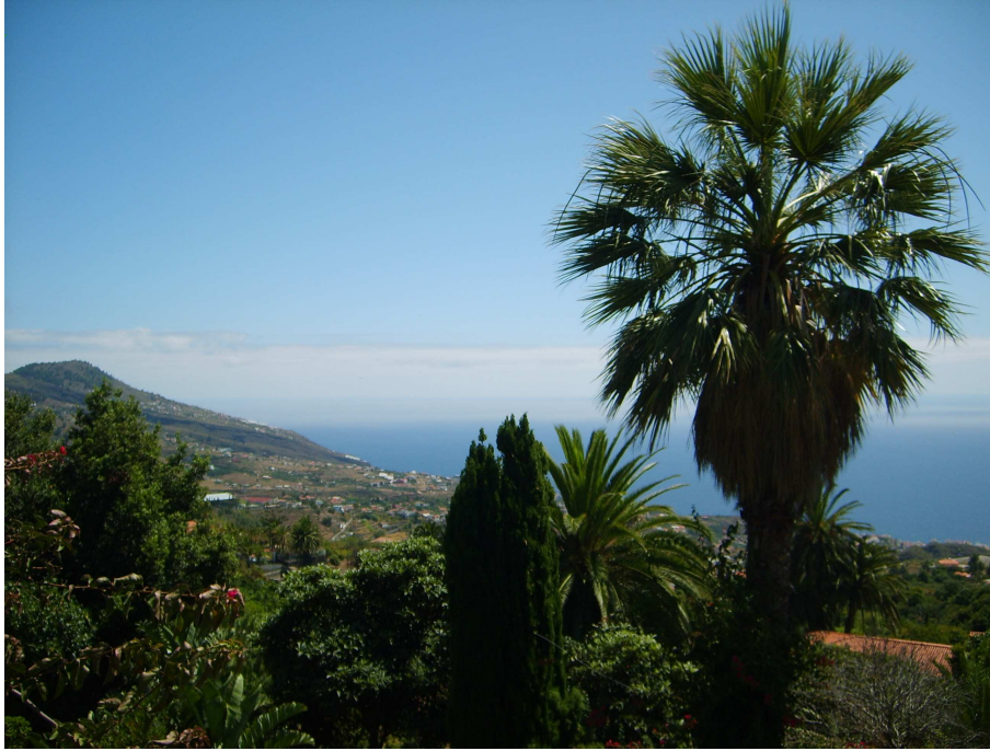
Abb. 3: Finca in Velhoco, La Palma: Lorbeer, Mispel, Zypresse, Palmen 2011

Von H. G. Petzold 1979 gepflanzt von links nach rechts Laurus azorica , Eriobotrya japonica , Cupressus sempervirens , Phoenix canariensis , Washingtonia filifera .