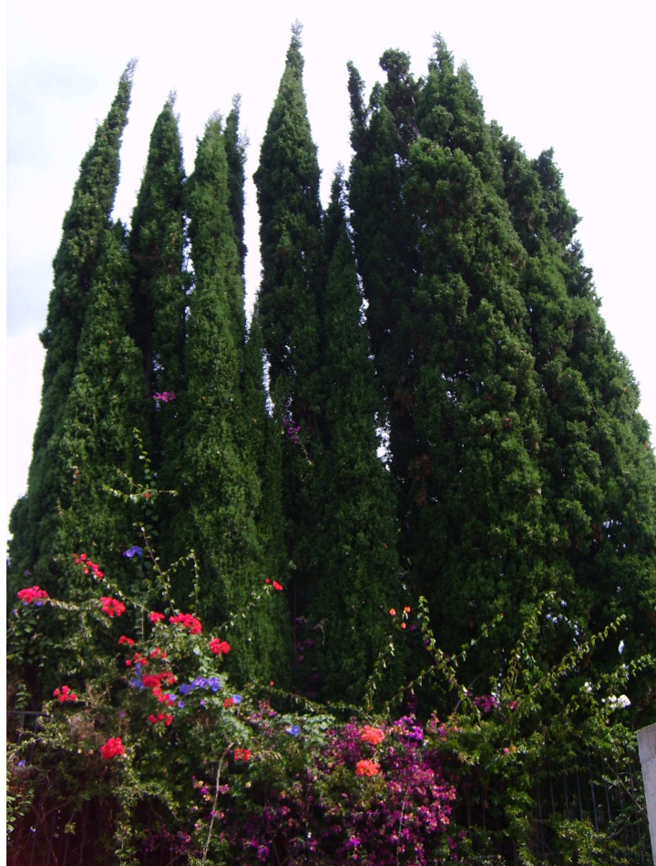
Abb. 8: Finca in Velhoco, La Palma: Zypressengruppe am Eingangstor 2011

Wenn man landschafts- und gartentherapeutisch arbeitet, erlebt man immer wieder, wie Menschen von einer starken „Freude am Lebendigen“ ergriffen werden, die sie mit tiefer Dankbarkeit und Liebe dem Leben gegenüber erfüllt – eine beglückende Erfahrung.