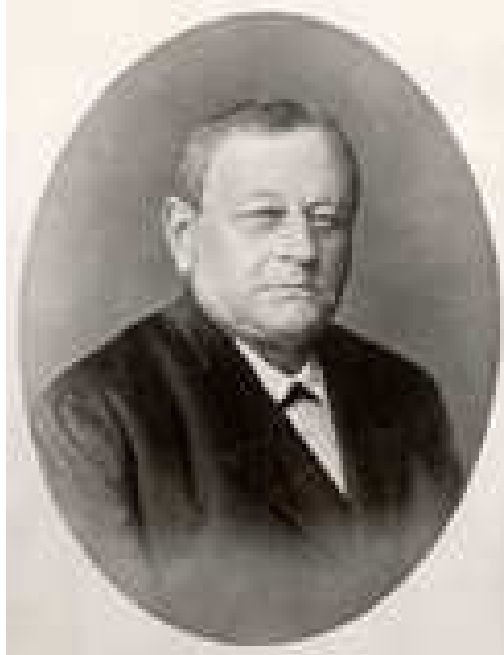
Abb. 5: Carl Eduard Adolph Petzold

Uns wurde Naturliebe, ja, Naturbegeisterung vermittelt in einer langen Tradition der Gartenkunst. Eduard Petzold [1815 -1891], der große Landschaftsgärtner, hatte ein bedeutendes kulturelles Vermächtnis – Gärten, die wir besuchten, und Werke, die in der Bibliothek der Familie standen – hinterlassen (vgl. zu ihm Rohde 1998).